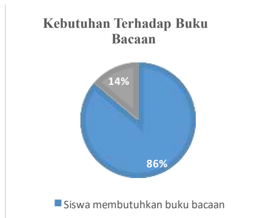
Gambar 5. Grafik Hasil Kebutuhan Terhadap Buku Bacaan