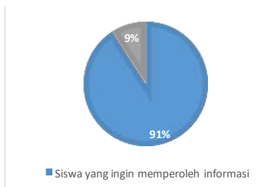
Gambar 8. Grafik Hasil Siswa Memperoleh Informasi

Dimensi keinginan dan waktu untuk memperoleh sumber informasi terdiri atas 2 indikator yaitu keinginan memperoleh komik, majalah, koran dengan 2 pernyataan dan indikator waktu memperoleh komik, majalah, koran dengan 1 pernyataan. Berdasarkan jawaban responden tentang dimensi Keinginan dan Waktu untuk memperoleh sumber informasi diperoleh hasil 91%. Hasil tersebut menunjukkan bahwa siswa aktif dalam memperoleh informasi dari buku bacaan dibandingkan bermain. Gambar 8 menunjukkan hasil siswa memperoleh informasi sebagai berikut: