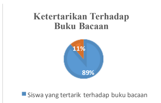
Gambar 6. Grafik Hasil Ketertarikan Terhadap Buku Bacaan

Dimensi ketertarikan terhadap buku bacaan terdiri atas 2 pernyataan. Berdasarkan jawaban responden, ketertarikan terhadap buku bacaan diperoleh hasil 89%. Hasil tersebut menunjukkan bahwa siswa memang memiliki ketertarikan dalam membaca buku. Gambar 6 menunjukkan hasil ketertarikan terhadap buku bacaan sebagai berikut: