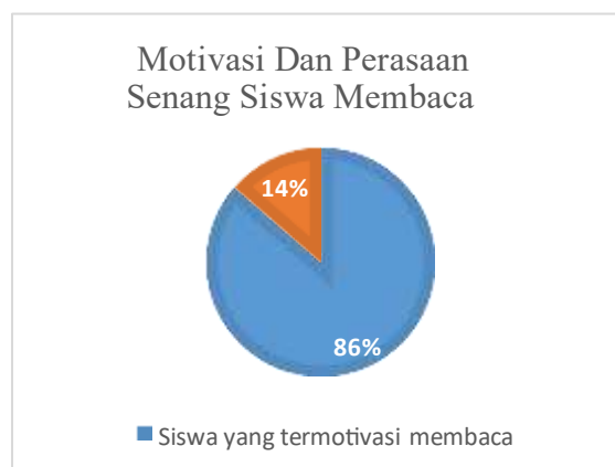
Gambar 4. Grafik Hasil Motivasi dan Perasaan Senang Siswa Membaca

Dimensi Motivasi Membaca Dan Perasaan Senang Membaca Buku Terdiri Atas 4 Pernyataan Yang Mengungkapkan Motivasi Dan Perasaan Semangat Dalam Membaca Buku. Hasil Penelitian Pada gambar 4 Hasil Responden Siswa Memiliki Perasaan Senang Dalam Kegiatan Membaca Buku.