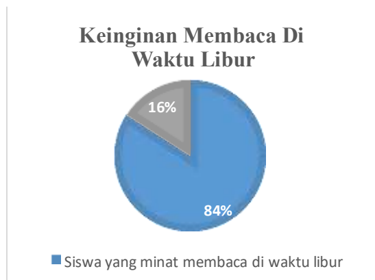
Gambar 7. Grafik Keinginan Membaca di Waktu Libur

bahwa siswa memiliki minat baca yang tinggi bahkan pada saat hari libur sekolah. Gambar 7 menunjukkan keinginan membaca di waktu libur sebagai berikut: