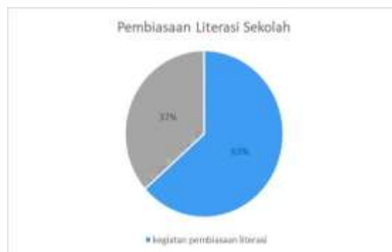
Gambar 1. Grafik Hasil Kegiatan Pembiasaan Literasi Sekolah

Berdasarkan hasil wawancara dengan guru kelas 3 diperoleh hasil bahwa siswa menjalankan kegiatan pembiasaan dengan baik dan dampak positif lainnya berupa peningkatan rasa percaya diri siswa dalam kegiatan membaca. Hasil penelitian pada gambar 1 menjelaskan kegiatan pembiasaan literasi telah berjalan sebanyak 63% dan cukup baik sebagai awal minat literasi murid. Hasil Kegiatan Pembiasaan Literasi Sekolah.